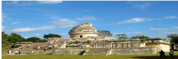
ICOMOS Mexicano colabora en las propuestas de Sitios y Monumentos para su ingreso en la Lista del Patrimonio de la Humanidad de la UNESCO

El ICOMOS Mexicano es el Comité Nacional Mexicano del Consejo Internacional de Monumentos y Sitios, organismo "A" de la UNESCO de carácter no gubernamental y fines no lucrativos, que reúne actualmente a más de 200 países a través de Comités Nacionales, agrupando personas e instituciones que trabajan en la conservación de monumentos, conjuntos y sitios, de interés arqueológico, histórico o artístico.