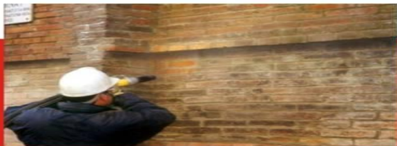
MPA ofrece equipos versátiles que permiten a los profesionales del sector de la restauración ejecutar una amplia gama de trabajos de gran calidad sobre todo tipo de superficies.

MPA, empresa especializada en tecnología para limpieza y tratamiento de superficies, estará presente con un stand en la próxima edición de FIRPA.